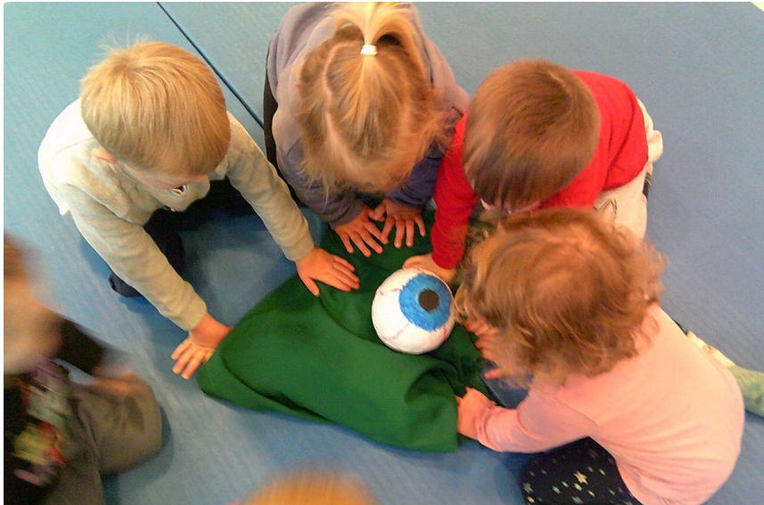
Fotos: Beispiele Augenscreenings und Vorbereitungen in Kitas, Frühjahr–Herbst 2025

Blinden- und Sehbehindertenstiftung Niedersachsen