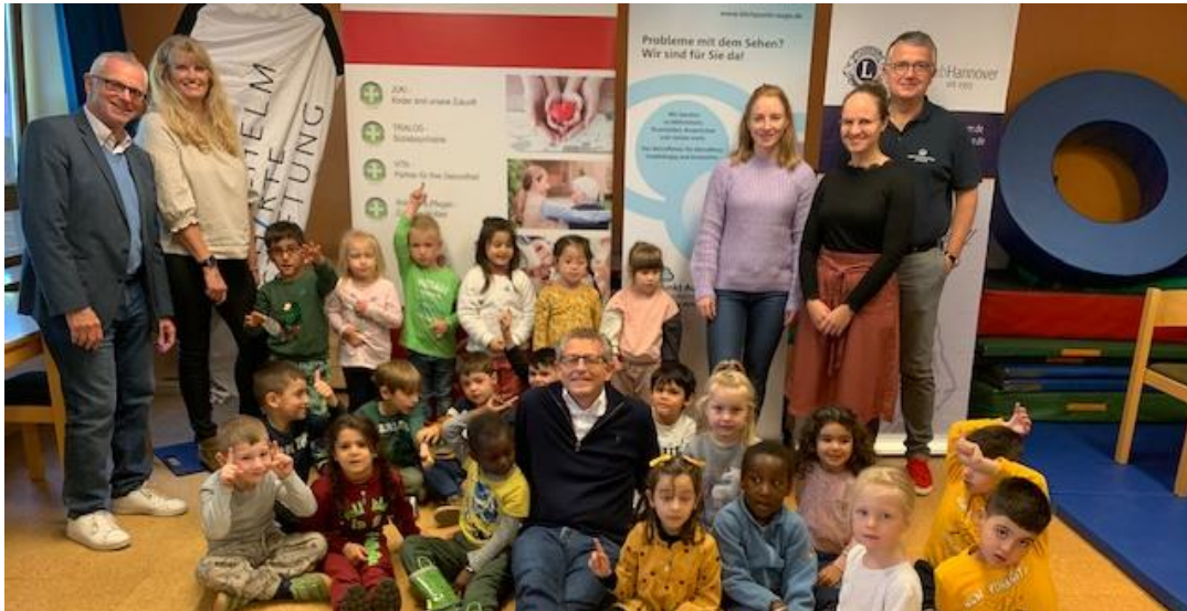
Foto: Pilotprojekt November 2022 in der AWO-Kita Laatzen